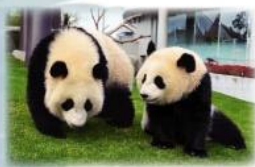
新たな出会いと感動空間 パンダファミリーに感動の大接近！