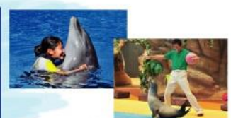
遠い昔から一緒だった 海からのやさしい贈り物に会う