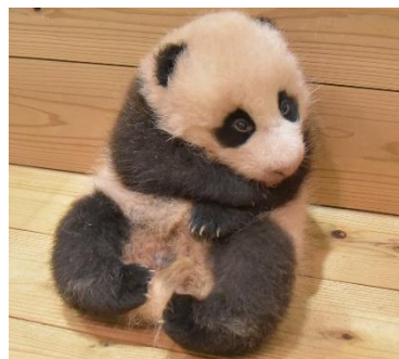
生後約2か月の結浜