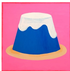
展示作品：ベッキー「富士山プリン」