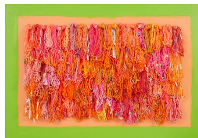
展示作品：ベッキー「あったかい」