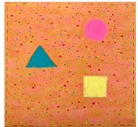
展示作品：ベッキー「人生はバラシイ」

金色に輝く星空の中、真っ白で雪のようなかわいらしい鏡餅 どこからか西洋の風が舞っているようなイメージを表現しました 西洋で生まれたレアチーズケーキと白いマカロンを丸い餅に見立てて 最後に金柑の甘露煮を添えた一皿