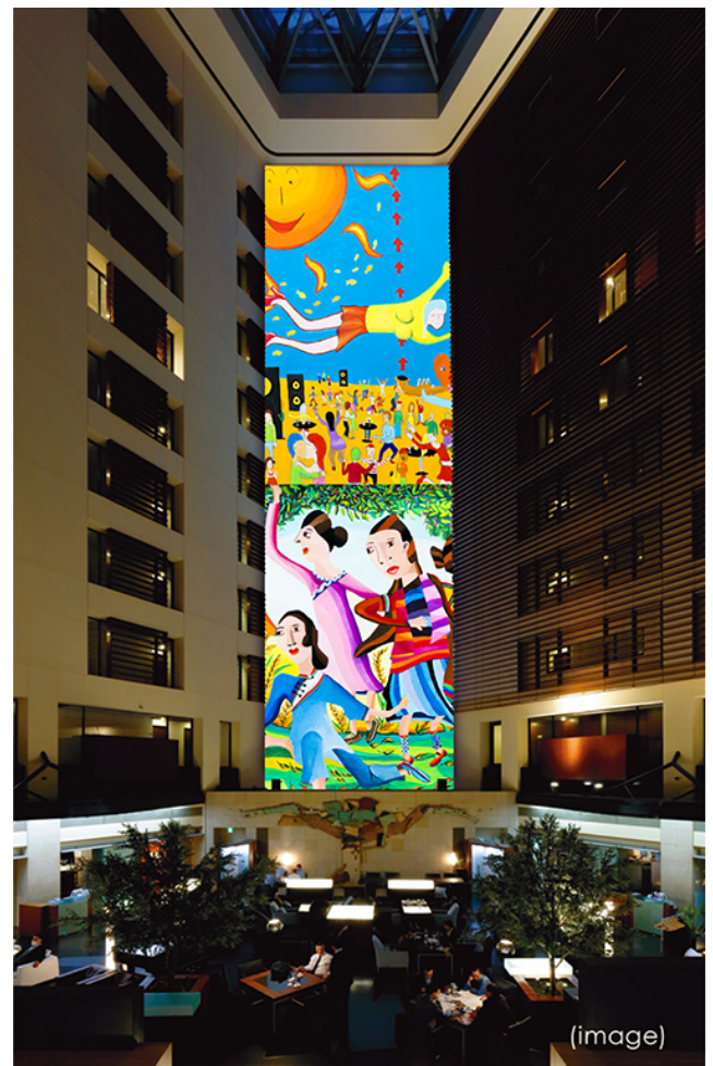
会場 / プロジェクションマッピング (イメージ)

夏らしい躍動的なエネルギー溢れるパークホテル東京の「夢を叶える-今日もわたしは描いている-」で、自由で開放的な夏をお楽しみください。