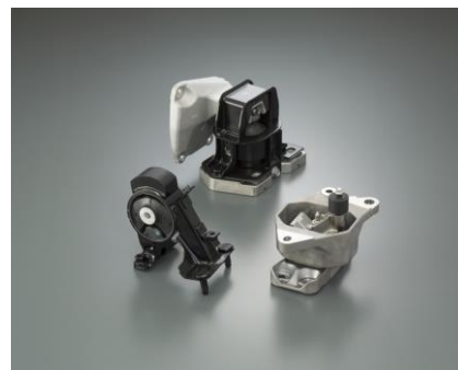
トヨタ自動車の FCV「MIRAI」に搭載されているモーターマウント

当社グループはこれまでに、モーターを使用する EV や PHV・PHEV、FCV など NEV 向けに、モーターマウントを供給してきました。モーターを支持しながら、エンジンとは違う高周波領域のモーター振動とそれに伴う不快な騒音を低減し、走行時の乗り心地の向上を果たします。日本をはじめ、中国・欧米でも採用実績があり、大衆車から高級車まで幅広く使用されています。