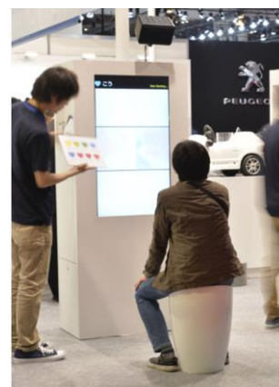
イスの座面に SR センサが内蔵されています

今回はこの SR センサが内蔵された、座るだけでバイタルデータを検知する特別なイスを出品し、来場された皆様に体験いただきます。