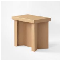
danbal 111M 格納型デスク W750×D500×H700mm 価格：6,050円（税込）