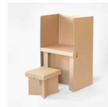
danbal 131M 簡易パーテーション W750×D560×H1300mm 価格：7,700円（税込）