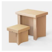
danbal 101S 格納型チェア W410×D410×H400mm 価格：4,290円（税込）