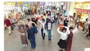
●商店街から本店前へ 画面転換