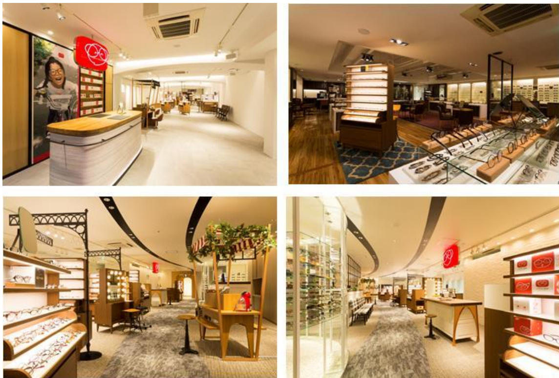
【メガネの田中 新本店 店内写真】