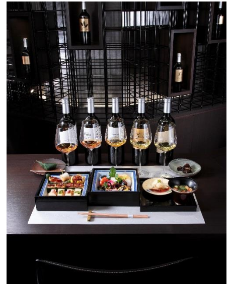
【ベジタリアンランチ】