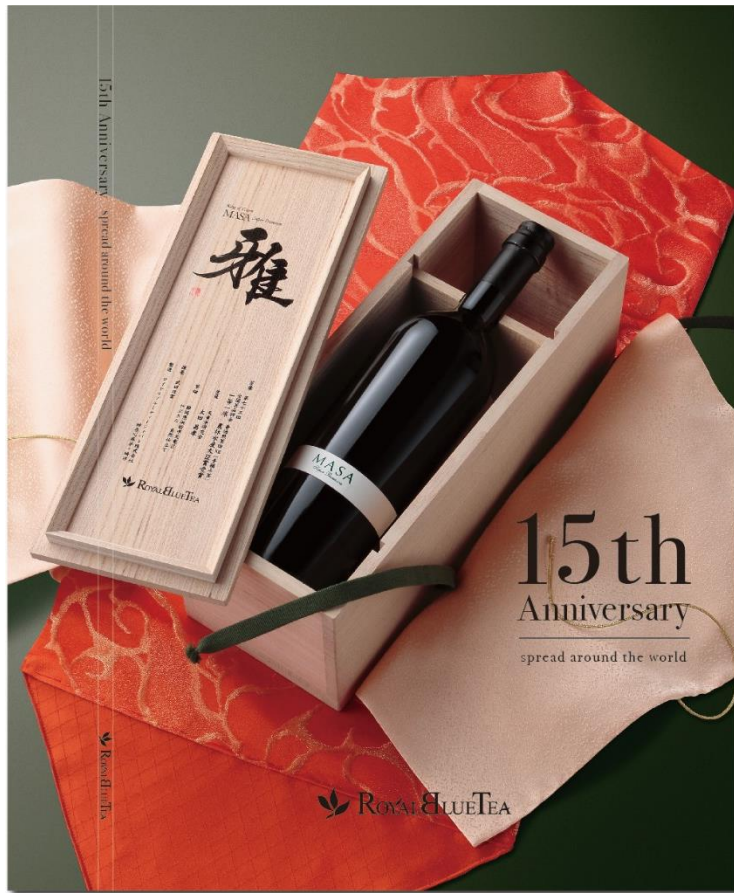
May 2021 (C)ROYAL BLUE TEA ロイヤルブルーティージャパン株式会社、会社設立15年記念誌表紙

ロイヤルブルーティージャパン株式会社は設立以来、3つのブランド・ミッションを凡事徹底、励行しています。