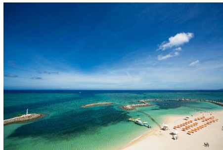
サンマリーナビーチ