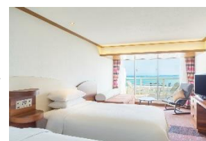
客室：デラックスツインルーム

改装工事を終えた客室（200室、うちスイート18室）は、東シナ海の絶景を眺望できるバルコニー付きのオーシャンビューで、スタイリッシュな空間にシェラトンのシグネチャーベッド、レインフォレストシャワー、高速インターネット、液晶薄型テレビを備え、広々としたワークスペースもございます。