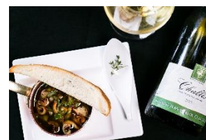
ペアードメニュー

「アトリウムラウンジ (Atrium Lounge)」では、最高級のワインや地ビールと共に、料理人の技が光る小皿料理や厳選したおつまみをご提供するシェラトンの新たなコンセプト、ペアード (Paired) アトリウムラウンジ：ペアードメニューをご用意しております。