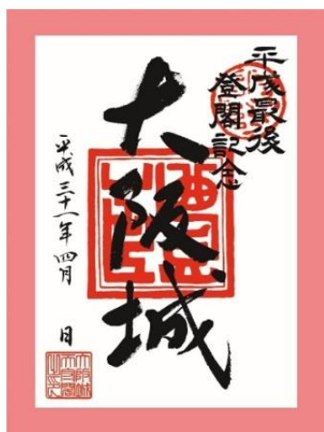
平成最後の入館記念 大阪城天守閣「登閣符」

さらに、GW期間限定で、お子さまはミライザ内にある「イリュージョンミュージアム ～幻影博物館～」と、夜の大阪城公園を歩く「サクヤルミナ」に無料でご入場いただけます。(イリュージョンは11歳以下、サクヤルミナは4歳～12歳)