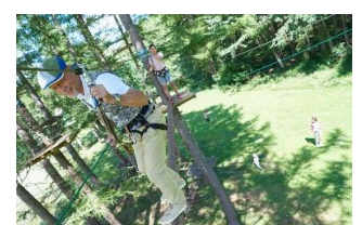
ツリートレッキング