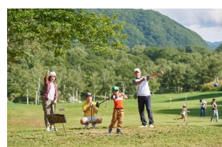
グラウンド・ゴルフ