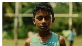
イスル OFF NA: 絶対にトライしてやる