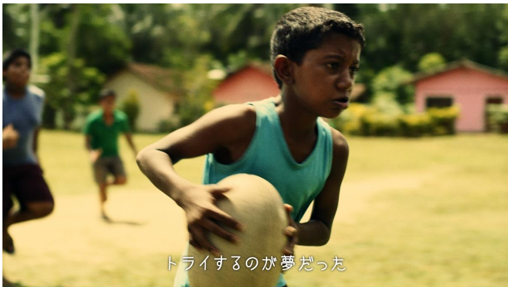
新 TV-CM 『Try For Dreams.』篇より