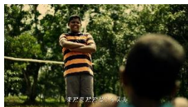
ガヤン: まだまだだな！イスル