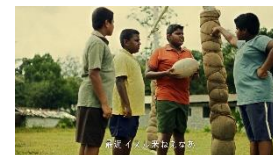
ガヤン: 最近イスル来ねえなあ