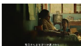
明日から水は ボクが運ぶから