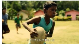
イスル OFF NA: トライするのが夢だった