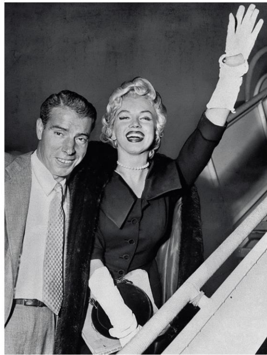
左/ マリリン・モンローが愛用したミキモトのパールネックレス 右/ネックレスをプレゼントしたジョー・ディマジオとマリリン・モンロー