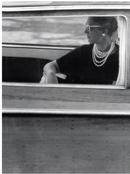
1950～60年代に人気を博したボリューム感のあるパールネックレス