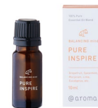
エッセンシャルオイル