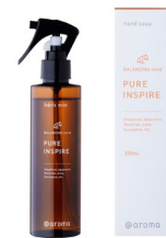
ファブリックミスト