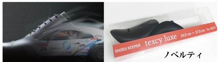
↑ 「アブソリュートバリュース」シリーズ