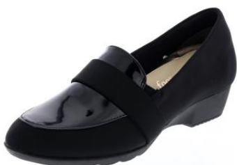
▼ FS-16800 / ブラック