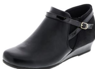
▼ FS-16960 / ブラック