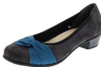
▼ FS-15340 / グレーパープル