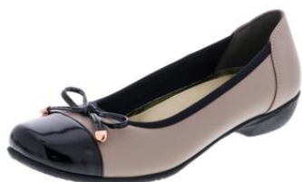
▼ FS-15310 / オーク

【「footsuki」ブランドのアイテム】 「footsuki」ブランドの設計特徴を搭載したモデル