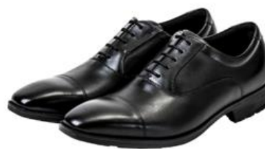
フレキシブルドレス TU-7010