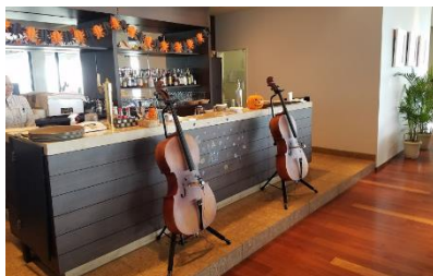
ホテルのラウンジ・レストランでの様子

社会性 生演奏とスピーカーの中間の様な存在です。音楽教育、医療、商業施設、マスコミ、博物館、弦楽器製作の支援まで、臨場感のある音楽を、今までに全く無い形式で提供することができます。