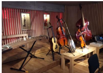
弦楽器による疑似コンサートの様子