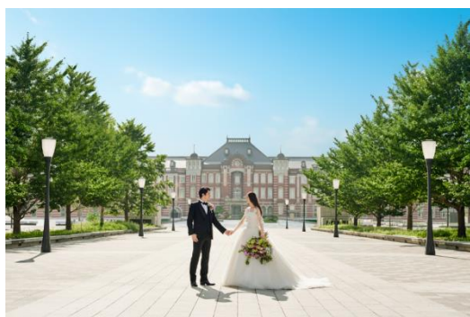
〈東京の中心で結婚式を〉

T&G と東京會館は、2016年10月に婚礼部門の業務提携を行い、東京・丸の内にある東京會館本館のリオープン（2019年1月予定）に向けてのマーケティング調査、コンセプト設計、料理や演出などの商品開発などを行ってまいりました。