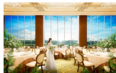
〈バンケットルーム・ロイヤル〉