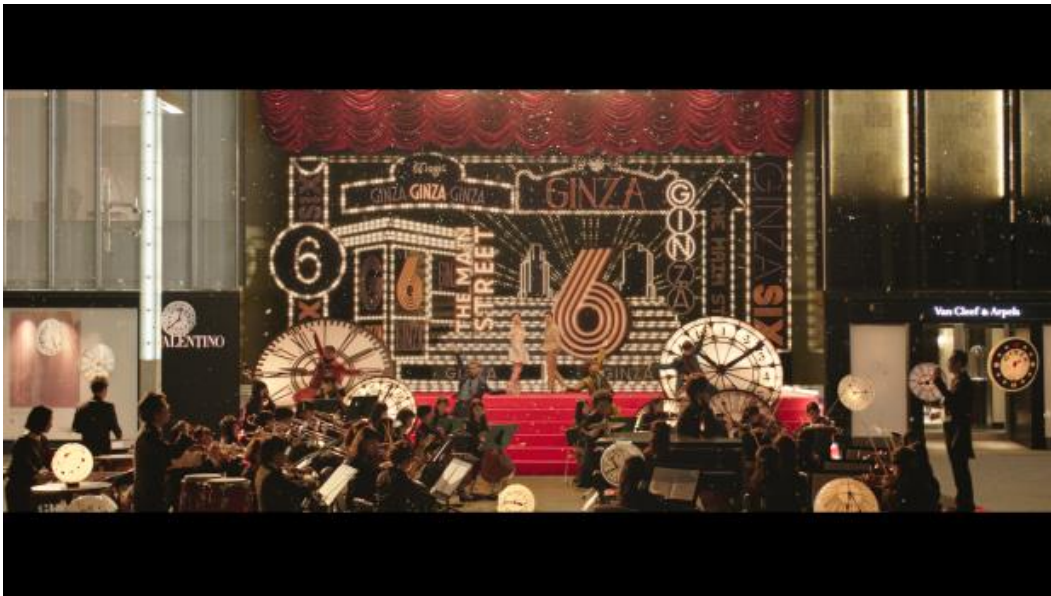
GINZA SIX スペシャルムービー「メインストリート」篇より

音楽家の椎名林檎さんが、満を持して、ロックバンド「ウルフルズ」のボーカル、トータス松本さんへデュエットをオファー。トータス松本さんの快諾を受けるや否や、椎名さんは、銀座と、二人の声をモチーフに、新曲『目抜き通り』を書き下ろしました。GINZA SIX × 椎名林檎 × トータス松本という夢のコラボレーションが実現。引っ込み思案で照れ屋な二人がハーモニーを奏でる『目抜き通り』を背景に、幻想的かつラグジュアリーなスペシャルムービーが完成しました。