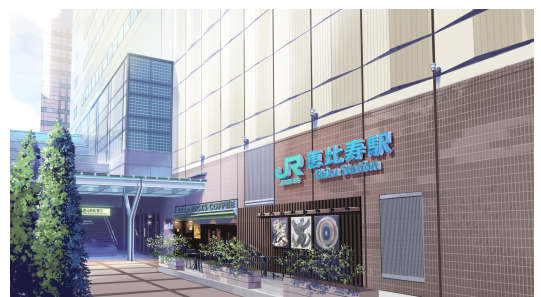
アニメで描くことで美しく映る日常の景色