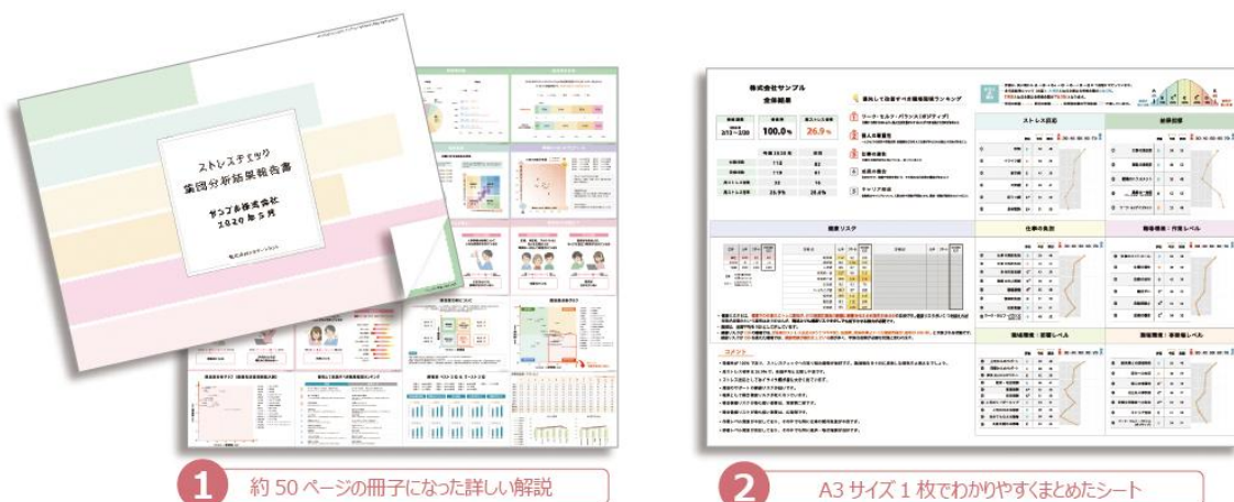
図 1：ドクタートラスト独自の集団分析

「ストレスチェック実施サービス」の詳細： https://www.stresscheck-dt.jp/