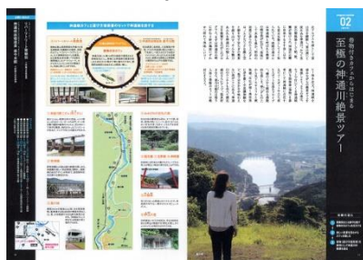
～巻物付きカフェからはじまる～至極の神通川絶景ツアー(富山市)

例えば、富山市を縦断して富山湾へと流れ込む神通川にある県定公園「神通峡」で、神通峡遊び方指南書(巻物)を参考にして、ビュースポットなどをドライブで巡る、～巻物付きカフェからはじまる～至極の神通川絶景ツアー(富山市)。日本の渚100選に選ばれ、立山連峰の大パノラマを望む「雨晴海岸」で、海岸近くのカフェや浜辺で絶景ランチを満喫した後、海上でSUP(スタンドアップパドル)を体験する、～食べて・遊んで・歩いて～ココロ晴れる、雨晴海岸の過ごし方(高岡市)。