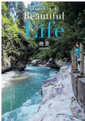
-表紙(黒部市・黒部川、猿飛峡)-

(公社)とやま観光推進機構と富山県、及び県内13市町(※)では、秋の行楽シーズンに向けて“体験型観光プログラム「大人の遊び、33の富山旅。」」シリーズの今年度第1弾として、～Beautiful Life 絶景スペシャル～ ハンドブックを、2017年9月上旬より都内のアンテナショップ(日本橋、有楽町)、都営地下鉄線(10駅)等、首都圏、北陸、関西、東海等で8万部配布します。ハンドブックでは、公式ホームページ ( http://33toyamatabi.jp/ ) において7月1日より順次公開している17の絶景プログラムを紹介しています。 ※一部町村を除く。