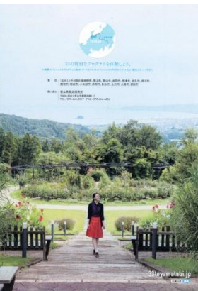
-裏表紙(氷見市・あいやまが-テ-)