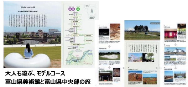
大人も遊ぶ、モデルコース 富山県美術館と富山県中央部の旅

ぜひ、ハンドブックを入手いただき、 「33富山旅」が提案するディープな富山旅にお出かけ下さい。