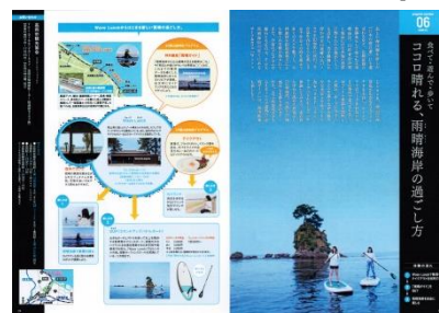
～食べて・遊んで・歩いて～ココロ晴れる、雨晴海岸の過ごし方(高岡市)

【一般のお問合せ先】富山県 観光振興室 TEL : 076-444-3517 【報道関係者お問合せ先】「富山県広域観光コンテンツ事務局」(ストライク&パートナーズ内) 担当 : 大津 TEL : 070-5075-3230、Eメール : strikeohtsu@gmail.com ※プログラムのメイン写真(右頁)は、文字抜き写真のご用意があります。