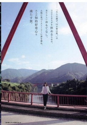
-導入ページ(富山市・観光橋、神通峡)-

「大人の遊び、33の富山旅。(以下、33富山旅)」は、富山県と県内市町の広域連携事業として、2013年より年2回「大人の知的好奇心を満たす」をコンセプトに体験型観光プログラムを開発し、ハンドブック(B5版)及びホームページでご紹介しています。おかげさまで、ハンドブックは、計8冊、シリーズ累計50万部以上発行しました。「33富山旅」固定ファンも定着し、ご好評いただいています。