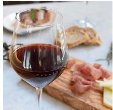
アペリティーボセット（イメージ）

映画公開中（東京・岩波ホール）の10月28日（土）から11月25日（土）まで、グランスタ丸の内店で、映画の舞台トリノがあるピエモンテ州のワイン（スパークリング・赤・白）と、本場イタリア産ハムとサラミ、チーズとともに、トリノで生まれた香ばしいスティック状のパン“グリッシーニ”をご堪能いただけます。【アペリティーボ】セット 1280円（税込 1382円）をご提供します。