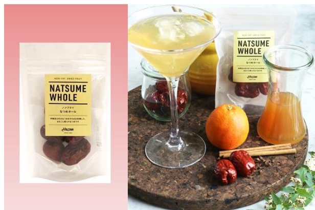
「なつめホール」 417 円 (税別) 内容量 40g