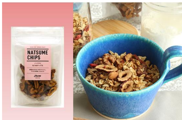
「なつめチップス」 417 円 (税別) 内容量 25g

世界三大美女のクレオパトラや楊貴妃がその美貌と若さを保つために好んで食べたという『なつめ』と『クコの実』を、手軽なおやつとして毎日の食生活にとり入れて、ウィズコロナ時代を美しく健やかに過ごしましょう。