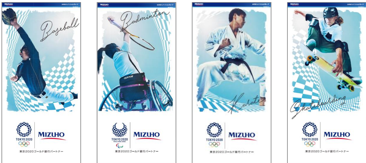
東京 2020 オリンピック・パラリンピック応援ボードデザイン (左から野球、バドミントン、空手、スケートボード)

日本で古くから親しまれている市松模様をモチーフにしたデザイン。オリンピックメダリストやプロ選手など競技実績をもつ国内外のアスリートを起用し、各競技の魅力伝えるダイナミックで躍動感のある動きを表現しました。