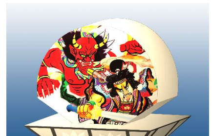
フューチャーねぶた (展示イメージ図) © Akagawa