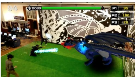
HADO MONSTER BATTLE