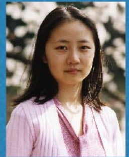
盧思 (京劇俳優・日本画家)