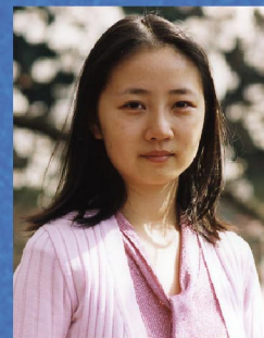
盧思 (京劇俳優・日本画家)

【お申込】日本京劇振興協会 080-4478-7009(担当:梅木) e-mail:1015@shincyo.com Web:https://www.shincyo.com