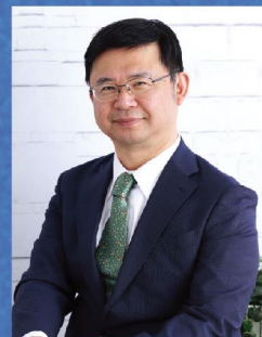
加藤徹 (明治大学教授)