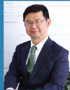
加藤徹 (明治大学教授)