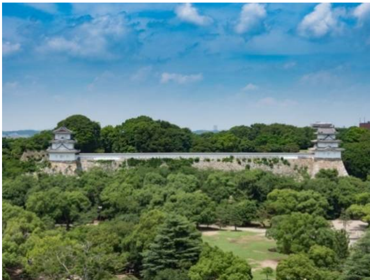
明石城（兵庫県立明石公園）