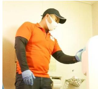
▲ユニゾン社による実習

公的3機関(アメリカ疾病センター、世界保健機構、厚生労働省)の認定した新型コロナウイルス対処方法を軸にダイヤモンドプリンセス号の除菌消毒作業を実施した実績があり、新型コロナウイルスに対する最高レベルの除菌消毒作業を提供しています。