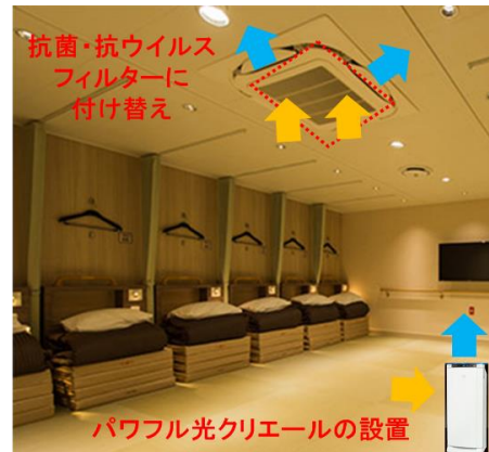
▲ツアーリストの対策例

その他当社の主な新型コロナウイルス感染予防対策の取り組みについては、次ページをご覧ください。