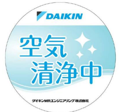
▲掲出用ステッカー