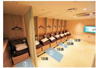
▲ツーリストの配席例(左:大阪/別府航路 右:大阪/志布志航路)