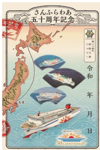
商船三井フェリー 御船印