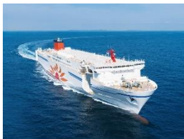
さんふらわあ さっぽろ・ふらの 大洗↔苫小牧