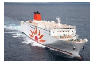
さんふらわあ さつま・きりしま 大阪↔志布志

大洗↔苫小牧航路は商船三井フェリーが、その他3航路はフェリーさんふらわあが運航します。