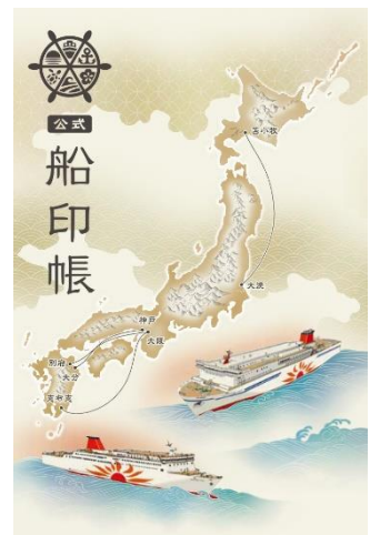
公式船印帳デザイン