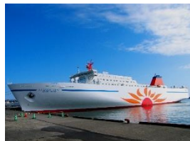
さんふらわあ しれとこ・だいせつ 大洗↔苫小牧