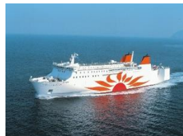
さんふらわあ あいぼり・こぼると 大阪↔別府