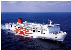
さんふらわあ ごーど・ぱーる 神戸↔大分