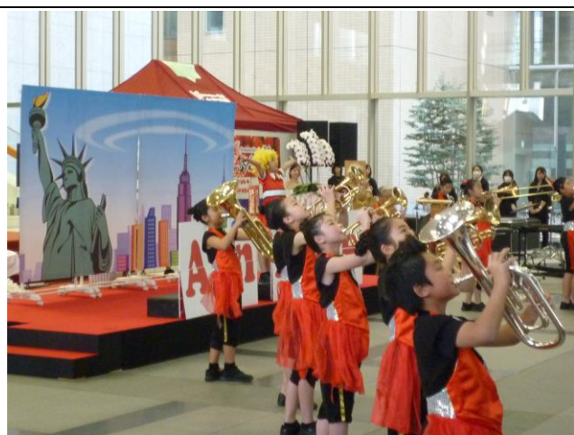
阿久津小学校金管バンド部