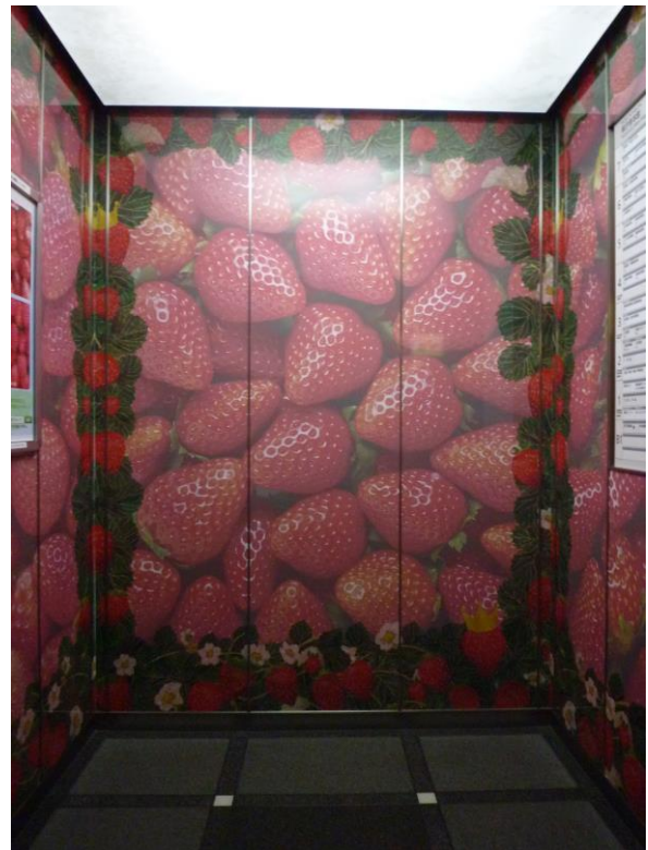
エレベーター内部写真（装飾は1機）