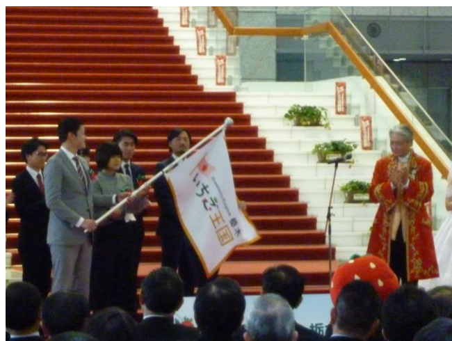
シンボルフラッグの授与