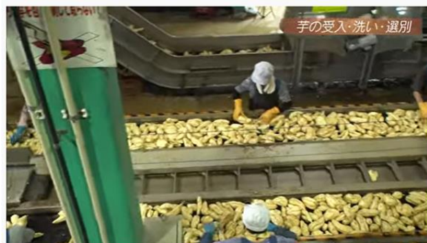
(傳藏院蔵・芋の受入・洗い・選別のシーン)

全国の本格焼酎ファンの皆様にとって、直接蔵元へお越しいただくことが難しい状況が続いています。また、芋焼酎の仕込みは、さつまいもの収穫時期である秋に行われ、製造の様子が見学できる時期に限られます。そんな中、昨年11月に、毎年リアルイベントとして実施している「新酒まつり」は、初のオンライン開催に挑戦し、焼酎蔵のひとつ「傳藏院蔵」のバーチャル工場見学動画を YouTube で公開したところ、大変ご好評をいただきました。そこで、全国の本格焼酎ファン、そして、新成人の皆様へ、鹿児島県の基幹産業である本格焼酎の魅力をお届けしたい想いを胸に、伝統の蔵「伝兵衛蔵」と継承の蔵「薩摩金山蔵」の動画を制作し、この1月に公開することにいたしました。