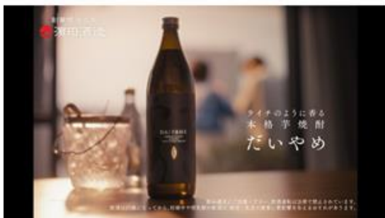
香る芋焼酎 だいやめ