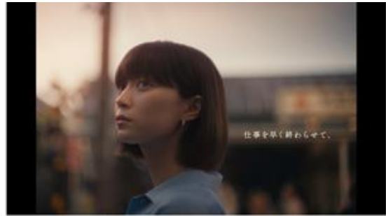
仕事を早く終わらせて