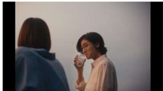
炭酸で引き立つライチのような香り