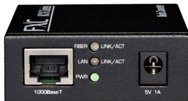
10/100/1000Mbps RJ45 ポート側

FXC 株式会社(本社:東京都台東区 代表取締役社長:谷輪 重之)は、ギガビットメディアコンバータ「NC1G シリーズ(AC Type)」を2020年6月19日(金)より販売開始致します。