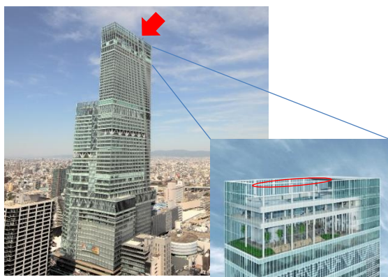
「EDGE THE HARUKAS」設置箇所

※当社調べ。「屋外」で「外壁のない」「地上300mを真下に見下ろせる」場所でのアトラクションは日本初となります。