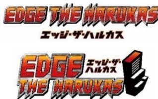
EDGE THE HARUKAS ロゴマーク