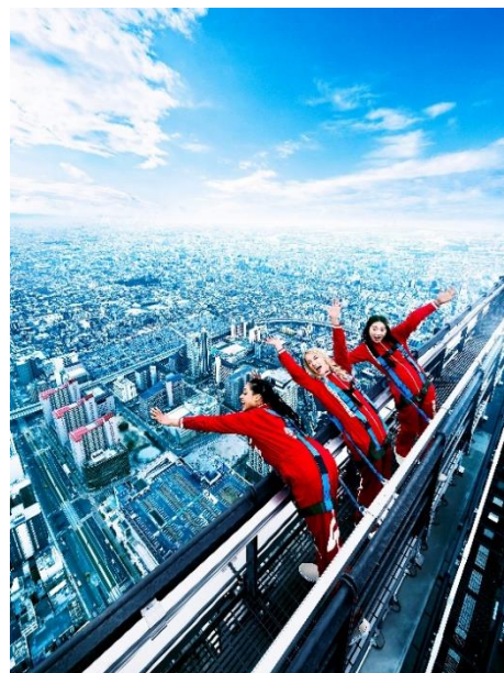
「EDGE THE HARUKAS」イメージビジュアル