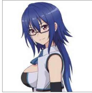
ブルー / 碓氷京子 (CV: 金元寿子) 技術委員