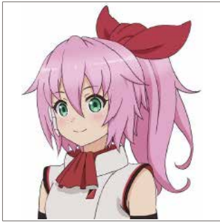
レッド / 渋川あずみ (CV: M・A・O) 弁当屋看板娘