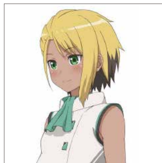
グリーン / 横須賀エリー (CV: 井澤詩織) 見学バスドライバー