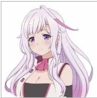
ピンク / 河合ひな (CV: 近藤玲奈) 広報担当