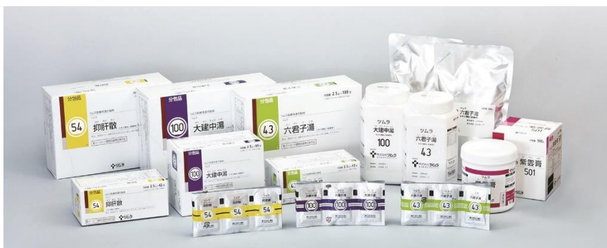
▲当社の医療用漢方製剤

※Copyright (c) 2020 IQVIA. 「JPM2020 年 3 月 MAT」をもとに当社が独自に集計 無断転載禁止