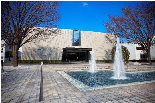
▲ツムラ漢方記念館の外観