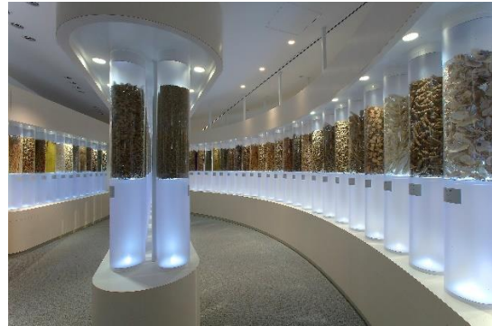
▲館内にある生薬展示ゾーン