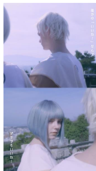
「NEOHENRO | 四国ネオ遍路(逆打ち ver.)」“謎の言葉”のシーン

また、逆再生によって「NEOHENRO」88箇所目から1箇所目に向けてプレイバックする中に、登場人物2人のメイキングシーンが随所に紹介されます。第1弾の「NEOHENRO | 四国ネオ遍路(順打ち ver.)」では決して見ることでできなかった2人の笑顔にあふれるオフショットの数々を経て、今回の動画テーマである「思い出映えの四国巡り」が最後にテロップで現れます。