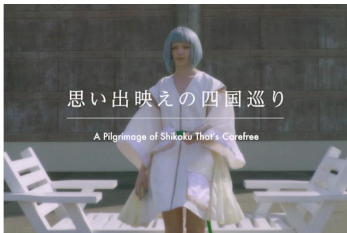
「NEOHENRO | 四国ネオ遍路 (逆打ち ver.)」カット

第2弾となる新ムービー「NEOHENRO | 四国ネオ遍路 (逆打ち ver.)」は、実際のお遍路を逆順に回る「逆打ち」になぞらえて、 インスタ映えではなく、“思い出映えの四国巡り” をテーマに、第1弾の「NEOHENRO | 四国ネオ遍路(順打ち ver.)」の逆再生した映像にメイキングシーンを織り交ぜたもので、四国の魅力を斬新に表現しています。