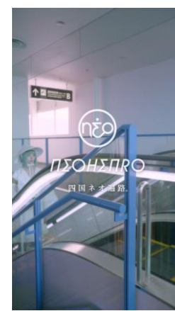
「NEOHENRO | 四国ネオ遍路 (逆打ち ver.)」より