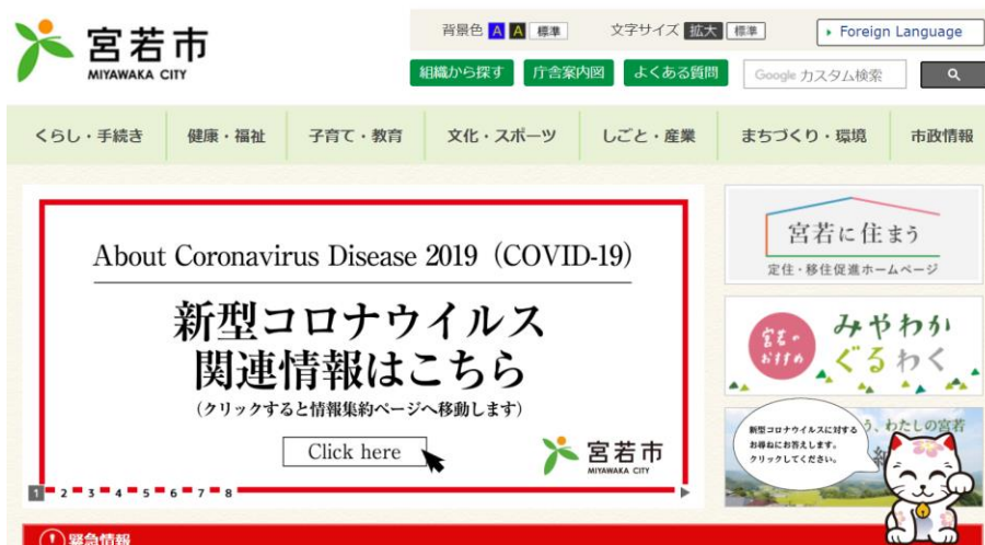
福岡県宮若市 公式ホームページ