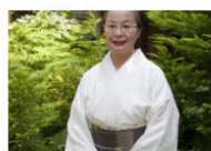
唐木さち花の教室 2024 6/13(thu) ~ 12/12(thu)