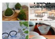
【まちなかWORKSHOP 2024 7月】参加者募集 7/1(mon) ~ 7/19(fri)