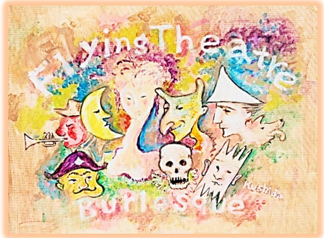
『Flying Theatre Burlesque』 フライングシアター自由劇場 串田 和美 画

ルーマニア シビウ国際演劇祭から串田和美ご夫妻かけつけます。 会費:1500円 定員40名