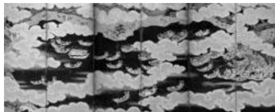
さんのうさいれいず 「日吉山王祭礼図屏風」 17世紀末 滋賀県立琵琶湖博物館蔵