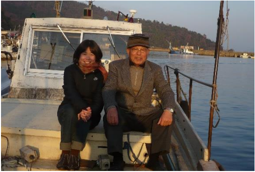
名人の職種は造林手、木工職人、漁師などさまざま