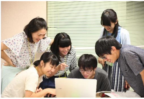
夏の事前研修では「聞き書き」の手法について学ぶ