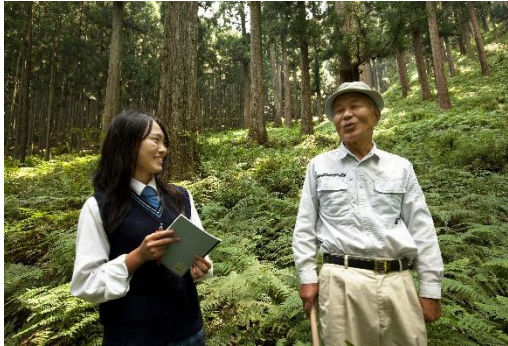
名人を訪問し、一対一で話を聞く