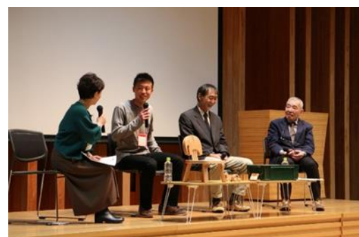
来年3月下旬には、成果発表会を開催予定