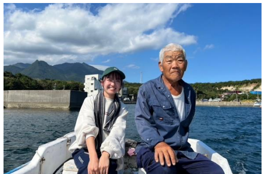
名人の職種は造林手、木工職人、漁師などさまざま