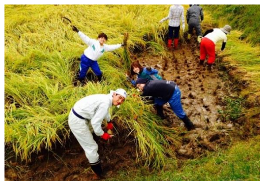
「聞き書き」後に、里山里海の保全活動や地域活動に取り組む卒業生たち