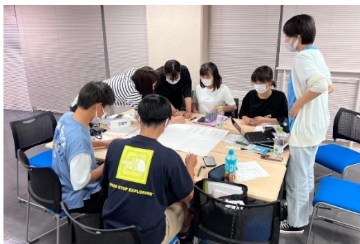
夏の事前研修では「聞き書き」の手法について学ぶ