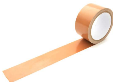
コレデ花粉ヲ貼り付ケテ 普通のガムテープ