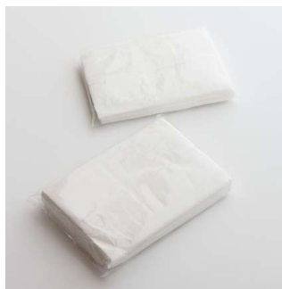
安クテモ涙ハ拭ケル 普通のティシュー