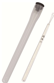
カユイノハ、ドコデシタツケ？ 高級プレミアム耳かき