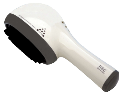
花粉ヲ家ニ持チコマナイ 花粉吸引ブラシ