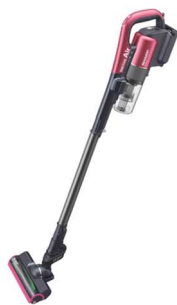
花粉ヲ吸イコメ サイクロン掃除機