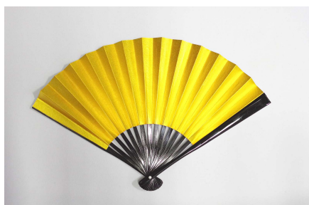
アオイデ花粉ヲ吹き飛バソウ 金の扇子