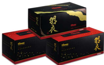
高級ティシューで涙ヲ拭イテ 最高級ティシュー