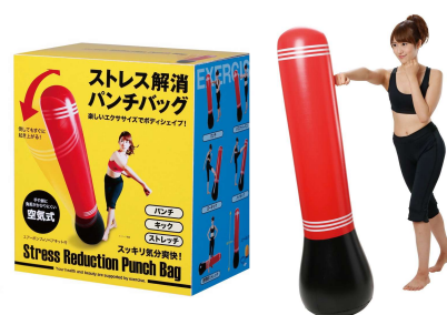
花粉ヲパンチデ撃退！ パンチバッグ