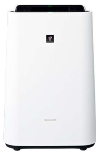
花粉ノ無イ部屋ニ… 空気清浄機