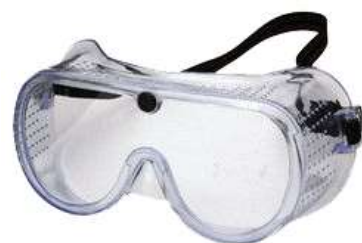
花粉ヲカナリ防ゲマス ビッグゴーグル