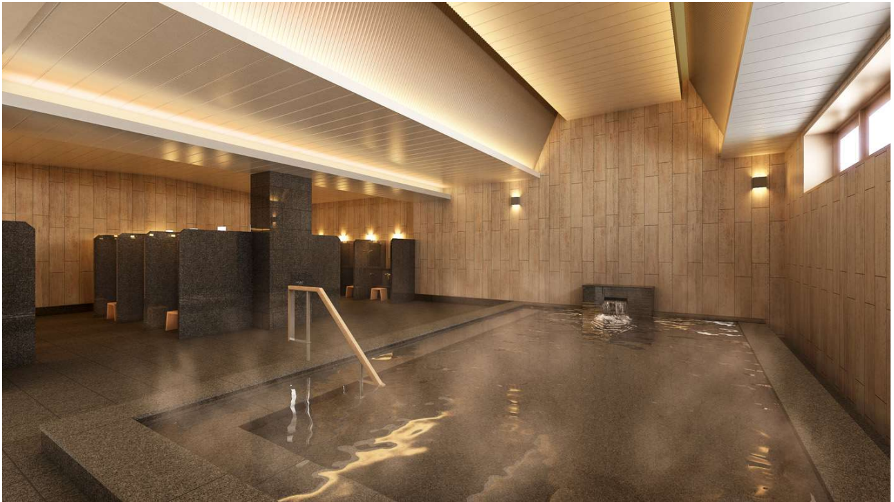
ホテルヴィスキオ京都 大浴場パース図 ※CG イメージ