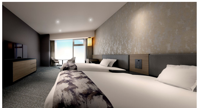
ホテルヴィスキオ京都 客室パース図 ※CGイメージ (左: モデレートツイン、右: スーペリアツイン)