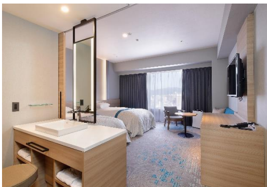
洗面台エリアをオープンにしたスーペリアツイン

エコノミーツインでは、ソファを設置するほか、スーツケースの収納スペースをベッド下に設け、コンパクトな空間の中、くつろぎのお時間をご提供いたします。