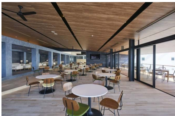
レッドウッド南港ディストリビューションセンター1