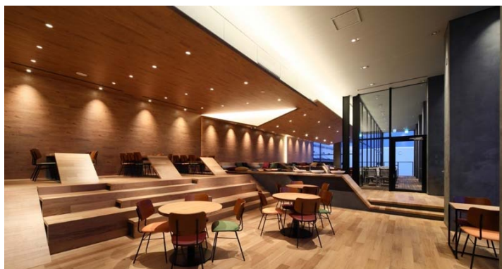
レッドウッド南港ディストリビューションセンター2