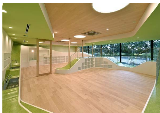
ESR 久喜ディストリビューションセンター