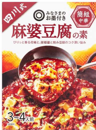
簡短中華 麻婆豆腐の素

唐辛子の辛さに甜麵醬とそら豆みその豊かなコクが自慢の商品です。甜麵醬とそら豆みそのうま味と風味のバランスが絶妙な商品に仕上がりました。麻婆豆腐の素と合わせてぜひご賞味ください。