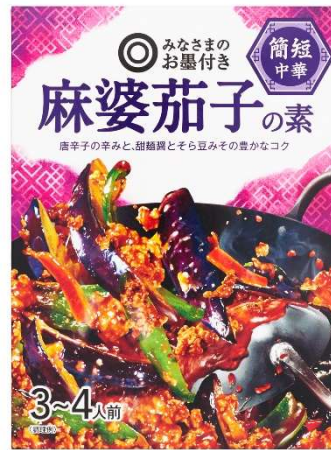
簡短中華 麻婆茄子の素