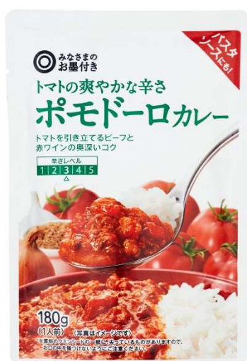
トマトの爽やかな辛さ ポモドーロカレー

生クリームとスパイスのまろやかさにレモンの酸味を加えたカレーです。ココナッツクリームと溶け込んだじゃがいものうま味に、レモンとりんごの爽やかな酸味を加えた、辛いカレーが苦手な方も食べやすい味わいです。